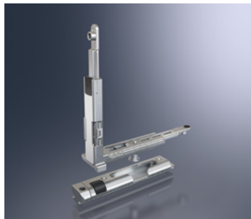
Rinvio d'angolo con rullino integrato e supporto anta Corner drive with integrated locking roller and with engagement block