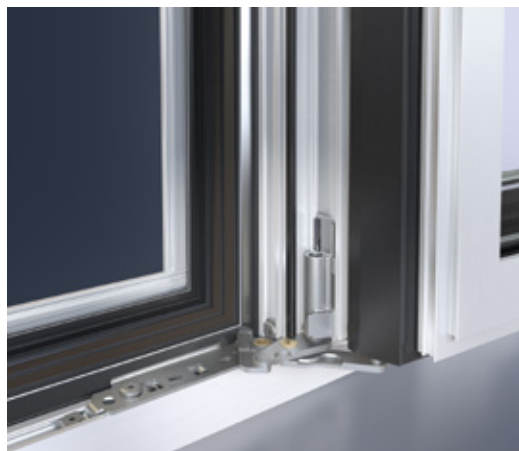
Cardine con angolo di apertura di 180° Corner pivot with 180° opening angle