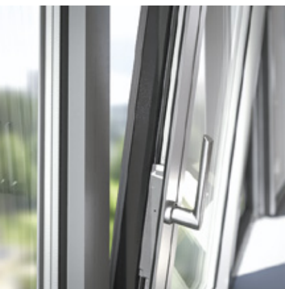
Asta di chiusura ibrida nell'apprezzato design in alluminio Hybrid locking bar in tried-and-tested aluminium design