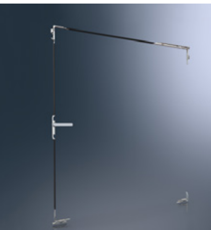
Configurazione dell'apparecchiatura per finestra ad anta ribalta Fittings configuration for turn/tilt windows