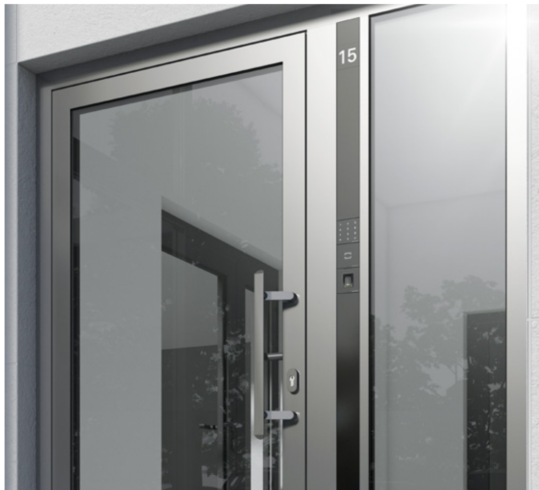
Controllo degli accessi per tutti gli edifici dell'edilizia privata di lusso Access control for any luxury home

Con il controllo degli accessi, Schüco offre soluzioni individuali per l'edilizia privata e per gli edifici commerciali. Per gli edifici commerciali più piccoli esiste una variante „stand-alone“ con ingresso master. I moduli lettore di schede, tastiera e fingerprint sono facilmente sostituibili come componenti di sistema. È possibile l'attribuzione personale di diverse azioni.