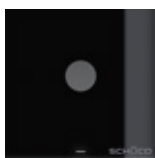
Modulo video Video module