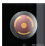
Pulsante di emergenza Emergency button