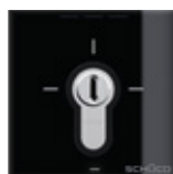
Interruttore a chiave Key-operated switch