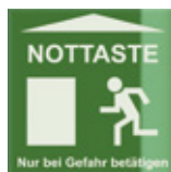
Targhetta pulsante di emergenza Emergency button sign