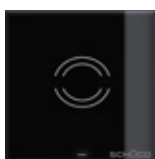
Sensore di prossimità Proximity switch