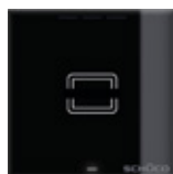
Letture di schede Card reader