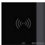
Sensore di movimento Motion detector