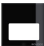
Luce spot LED LED spotlight