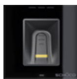
Impronta digitale Fingerprint reader